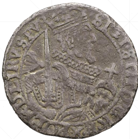
wybity - 5.54 g