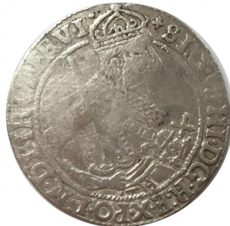
wybity - 6.57 g