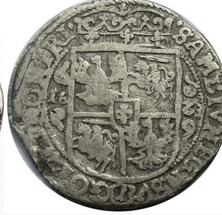
wybity - 4.95 g