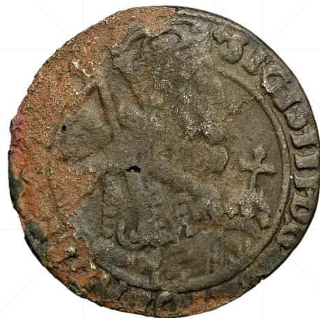
wybity - 4.63 g